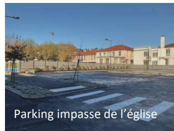
Parking impasse de l'église