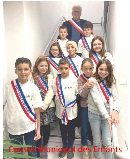
Conseil Municipal des Enfants