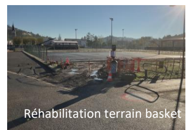
Réhabilitation terrain basket