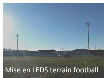
Mise en LEDS terrain football