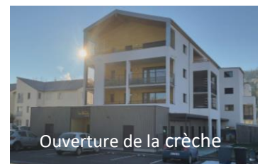
Ouverture de la crèche

Installation de supports à vélos devant tous les bâtiments publics